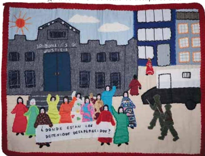
Figura 03 – “Onde estão os desaparecidos?”