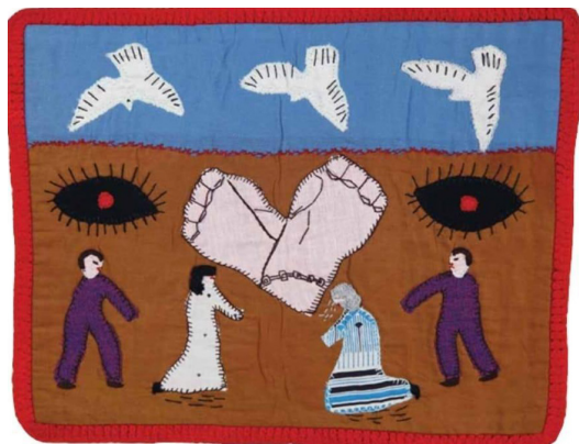
Figura 02 – “Aonde estão os nossos filhos”