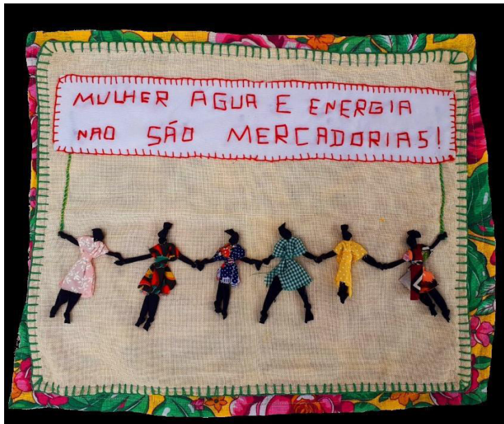
Figura 04 – “Mulher, água e energia não são mercadorias!”

Fonte: MAB - Exposição “ Arpilleras: Atingidas em defesa da vida - 2021 ”