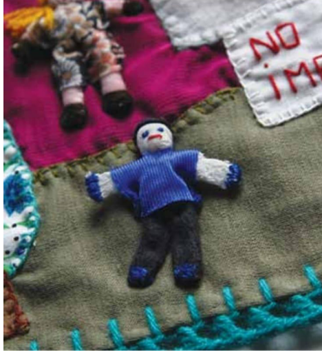
Figura 01 – “Não à impunidade!”